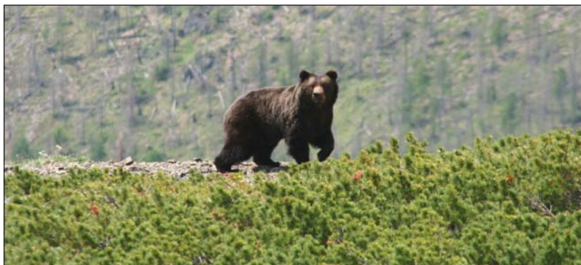
Бурые медведи востока региона имеют преимущественно черную окраску

Размеры медведей чаще средние и крупные. Длина тела 110–302 см. Высота в холке до 135 см, хвост очень короткий и обычно незаметен снаружи. У зверя 42 зуба, в том числе четыре крупных клыка, позволяющих наносить страшные раны жертвам. Масса от 50–80 до 500–700 кг. Как и вообще в целом о виде, о размерах бурых медведей описываемого региона ходит много легенд. Происхождение их вполне понятно: очень сложно найти в тайге инструмент для измерения веса такого животного. Самый большой бурый медведь, пойманный на острове Кадьяк (недалеко от Аляски) для Берлинского зоопарка, достоверно весил 1134 кг. Здесь встречаются и более массивные особи, но документальных подтверждений в нашем распоряжении нет. Максимальная длина ступни задней лапы без когтей – 38 см, чаще 25–30 см. Ширина следа 9–19 см.