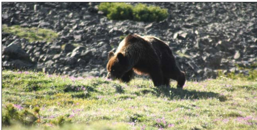
Бурые медведи региона преимущественно вегетарианцы

Основное поголовье бурого медведя территории ведет преимущественно вегетарианский образ жизни. Но определенная часть популяции занимается активной охотой. Преимущественно это крупные самцы в расцвете сил, убивающие животное в одиночку. Сообщество медведей, видимо, двух братьев, работавших в паре на охоте, мы наблюдали лишь однажды – в истоках реки Киркун на Хэнтэе. Здесь они вдвоем в результате очень нелегкой борьбы задавили крупного косячного жеребца. В четырех местах они его валили на землю, но конь поднимался снова и, пока хватало сил противостоять, отбивался копытами, поломав кустарник и подрост. Затем хищники разодрали лошадь пополам и закопали в мох, хвою и содранный здесь же дерн. Каждый убрал свою часть добычи в персональную кучу, оставив там дозревать до «деликатесного» состояния.