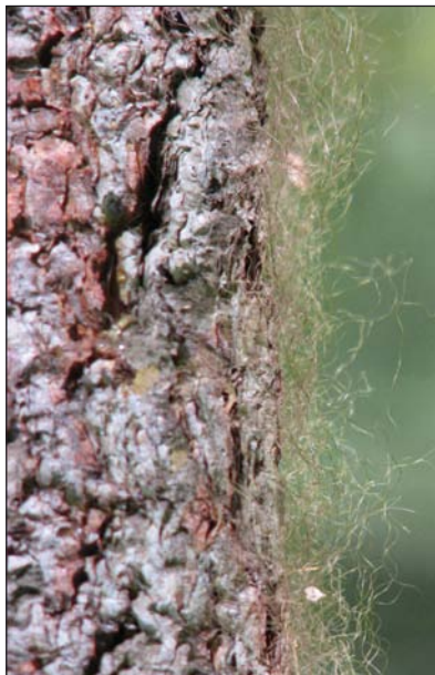
Шерсть медведя на маркировочном дереве

Отмечаться на маркировочных деревьях в принципе могут медведи любого возраста и пола. Считается, что такие действия полезны медведям во время линьки, а живица, налипающая на шкуру, отпугивает комаров и мошек. По этой причине американцы чаще называют маркировочные деревья деревьями-чесалами.