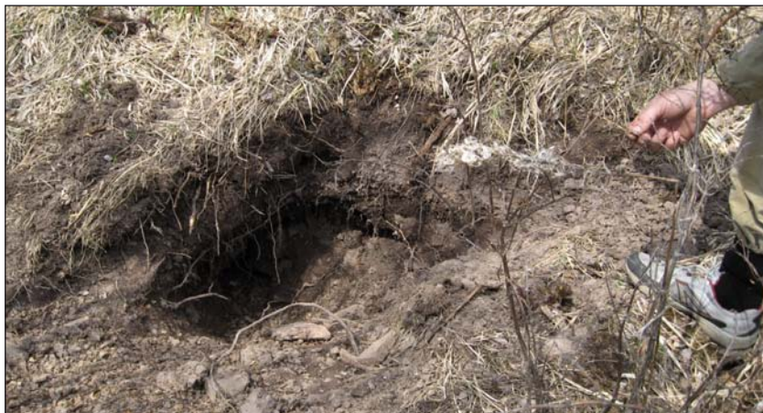
Покопки бурого медведя хорошо заметны

Медведь держится возле жертвы, пока не съест все годное в пищу. За эти дни он протаптывает хорошо заметную тропу к воде. На месте остаются кости жертвы, лежки медведя, деревья с метками и обтертыми основаниями корней. Весной при дефиците пищи медведь может вновь наведаться сюда.