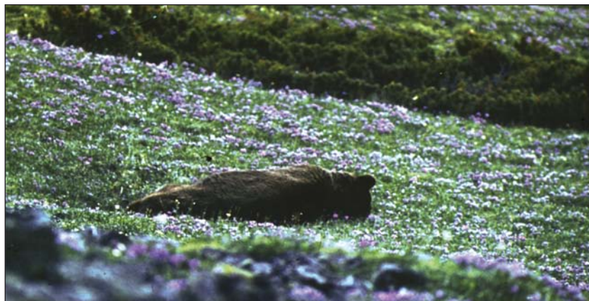
На высокогорных пастбищах медведи, несмотря на скученность, ведут себя спокойно

характерно исключительное многообразие условий. Даже в случае отсутствия плодоношения у основных жировочных кормов (кедр, ягодные кустарники) вполне можно найти участок, где дикоросы дадут урожай. Здесь собирается большое количество зверей, которые никак не проявляют враждебности друг к другу. Например, концентрация медведей отмечается в открытых ландшафтах высокогорья гольцов в период максимума цветения бобовых растений тундры (на востоке региона) и альпийского пояса (на западе территории) с середины июня по середину июля.