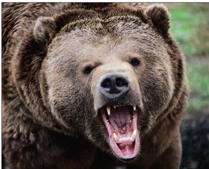
Непросто остановить нападающего медведя

встречающихся ему на пути людей и животных. Оружие должно применяться только профессионалами-охотниками и только в исключительных случаях, при вынужденных и плановых отстрелах зверей.