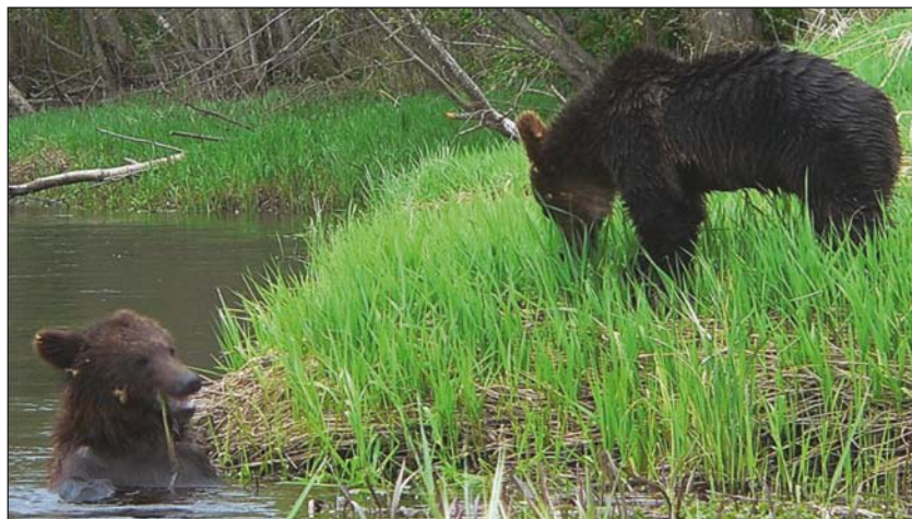
Места купания – неперенный атрибут медвежьей «квартиры»

по этому туннелю в высокотравье с карабином на плече и не успел толком испугаться, когда бесшумно вылетевший из зарослей медведь ударил его по лицу подушкой лапы так, что зубы пропечатались на внешней стороне щеки. При этом он не зацепил его когтями.