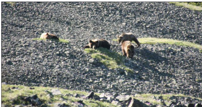
Самка с полуторагодовалыми медвежатами на гольцах

В Алтае-Саянском экорегионе период обучения молодых в семье обычно не превышает два с половиной года. Для медведиц, активно участвующих в размножении, семейный образ жизни длится большую часть их века. Медведи-подростки, взрослые самцы и прохолоставшие самки обитают, как правило, поодиночке.