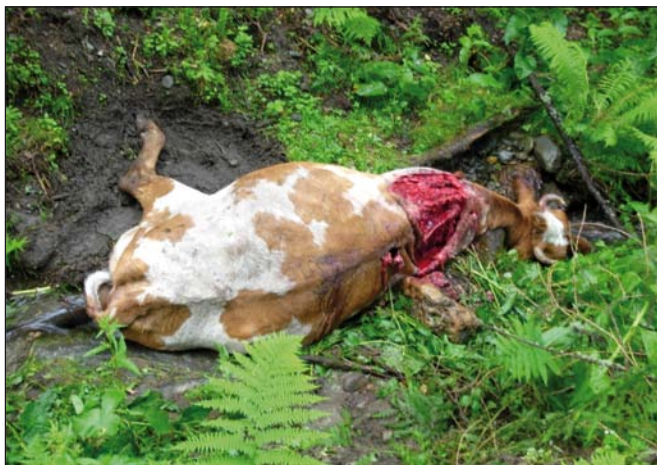
Корова, задавленная медведем в окрестностях поселка Яйлю

зверя загрузили в машину и вывезли в лес, даже не применяя специальных средств обездвиживания.