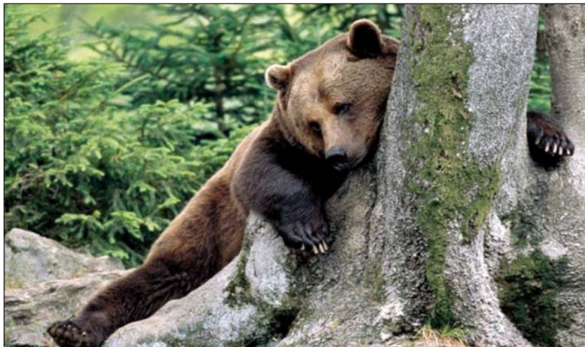
Любовь медведя к лесу безгранична

Практически на всем протяжении своего ареала бурый медведь – это типичный обитатель больших лесных массивов. Любовь зверя к лесу безгранична.