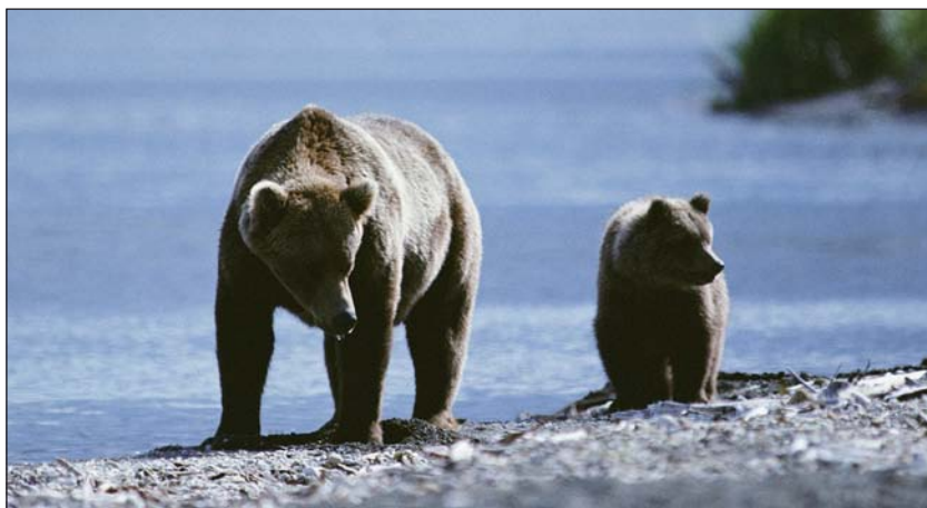
Первые уроки жизни

В последние годы немалый вред поголовью медведя наносит малоквалифицированная, но отлично вооруженная и оснащенная качественной внедорожной техникой армия состоятельных любителей отдохнуть на природе с оружием в руках. Паля из своих дорогих стволов направо и налево, они оставляют помимо обязательных цветастых помоек много подраненных зверей – потенциальных шатунов и скотинников, опасных в том числе и для человека. Им ассистирует в этом несколько поредевшая, но не утратившая прежних навыков команда записных браконьеров – рвачей, любителей поставить петлю или самострел на медвежьих тропах и у привады. В дальнейшем активность этого тандема будет возрастать, особенно если застопорится процесс закрепления охотничьих угодий за реальными пользователями.