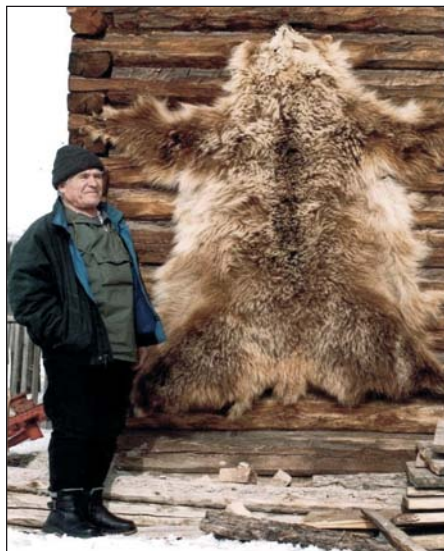
Шкура бурого медведя безлесных районов Республики Алтай отличается светлым, зонированным мехом

Согласно современным представлениям (Павлинов и др., 2002), звери, обитающие в пределах региона, относятся к одному из четырех видов рода Настоящих медведей – бурому медведю ( Ursus arctos L., 1758). Животные основной части территории (в пределах Кузнецкого Алатау, Алтая, Саян, Хэнтэя) относятся к восточно-сибирскому подвиду. В пределах Кош-Агачского района и на запад Тывы, видимо, проникает крайне редкий и не представляющий опасности тьяншаньский подвид, а на восток