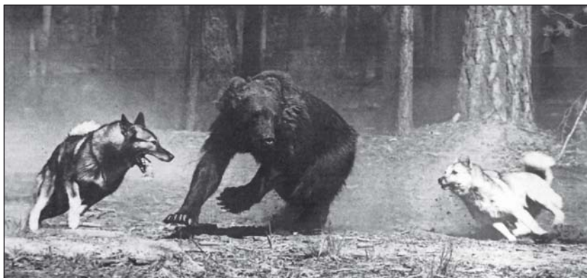
Собаки гоняют молодого медведя по улицам поселка в Республике Алтай

Однако несмотря на столь долгую совместную историю люди и медведи так и не смогли окончательно подружиться. Даже цирковые животные, пляшущие с завидным попаданием в такт и почти профессионально управляющие мототехникой, отнюдь не одомаш-