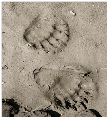
Отпечатки лап медведя на мокром грунте

Экскременты медведя могут показать даже при самом поверхностном осмотре основные составляющие его питания в последние дни (в зависимости от свежести); их распределение на почве поможет понять, был ли зверь спокоен или испуган. Разрытые муравейники и норы бурундуков, поковки на лугу (медведь мог кормиться подземными частями растений или ловил полевок) нередко имеют хорошо различимые признаки свежести.