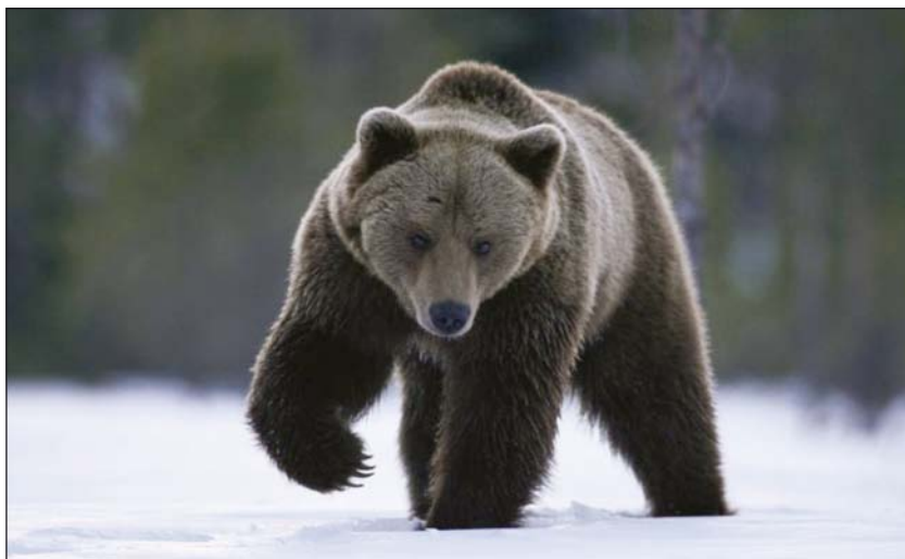
Идущие на зимовку по снегу медведи часто отдыхают по пути

Звери, идущие на зимовку, часто петляют и стараются проходить наиболее тяжелыми, захламленными местами, зарослями кустарников, валежниковыми крепями и крупнокаменистыми россыпями. Нередко этот путь в горах занимает несколько дней, и уже