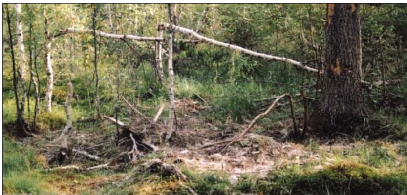
Опасное место: здесь медведь зарыл свою добычу (фото С. Пучковского)

медведей в альпийском и гольцовом поясах, недалеко от овсяных полей и в иных местах вероятного появления животных.