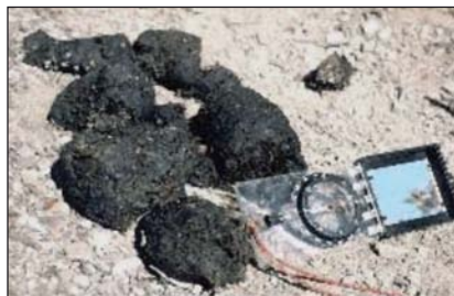
Помет бурого медведя

Бурый медведь может оставить следы когтей на почве, пне, палатке, крыле автомобиля, прикусить зубами любой объект, включая брошенный рюкзак, консервную банку, канистру или выступающую часть автомобиля. Предполагается, что несильные хватки зубами есть часть исследовательской деятельности зверя по отношению к незнакомым объектам. Медведь любого возраста и пола может поваляться (или потоптаться) на золе и пепле от сожженных предметов, порошках разной природы (мел, удобрения и т.д.), пятнах нефти и нефтепродуктов, любых других пахучих объектах. Позже он может потеряться о маркировочное дерево и запачкать его этими веществами.