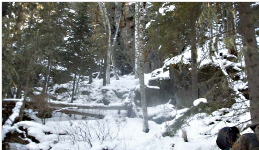
Типичное место расположения берлоги в горах Юга Сибири

На равнинах он отдает предпочтение старым хвойным и смешанным лесам, чередующимся с гарями, вырубками, болотами и водоемами. В зоне смешанных лесов бурый медведь обживает в основном старые, захлащенные насаждения вблизи моховых болот и места, где на незатапливаемых участках имеются подходящие условия для устройства зимних берлог.