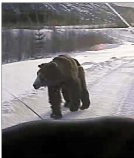
Через пару секунд отчаявшийся шатун нападёт на машину (видеофото)

Несомненно, что к декабрю (для нашего региона) все шатуны обычно погибают по тем или иным причинам. Прежде всего – от резко возросших потерь тепла и, как правило, полного отсутствия корма. Такой бродячий медведь по-настоящему «впадает в отчаяние» и проявляет нетипичное поведение. Например, зверь, запечатленный на помещенном видеокadre, без всяких предисловий и демонстраций, не увеличивая скорости своего движения, напал на машину с людьми, которые снимали его на