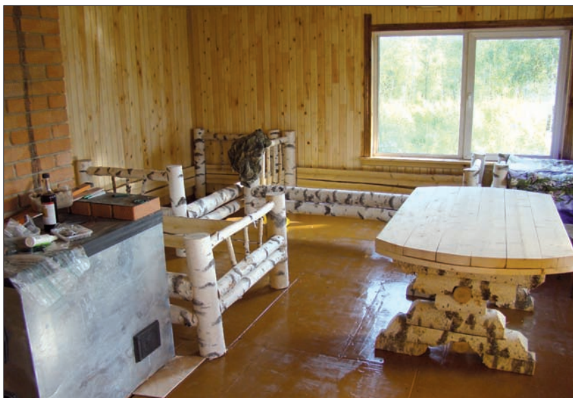
Формирование интерьера современного охотничьего домика в охотхозяйстве