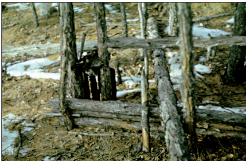
Опадной самолов на кабаргу – орудие браконьеров