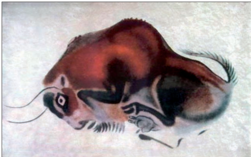
Спящий бык в пещере Альтамира