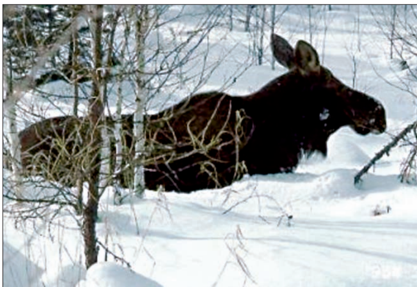
Лось с трудом передвигается в зимней тайге