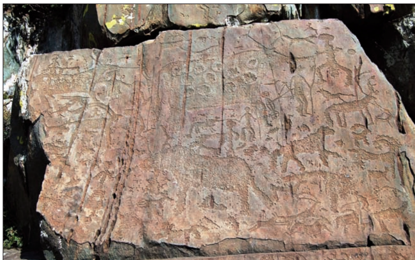
Сцены древних охот на петроглифах южного Алтая