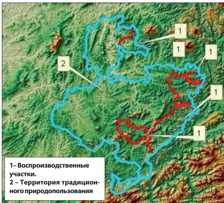
Схема функционального деления территории хозяйства ООиР Горной Шории