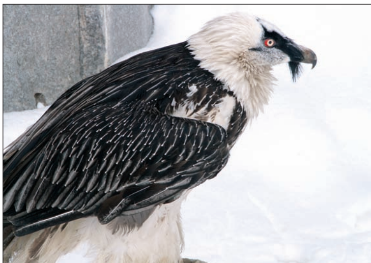
Бородач (ягнятник) – вид, включенный в Красную книгу РФ