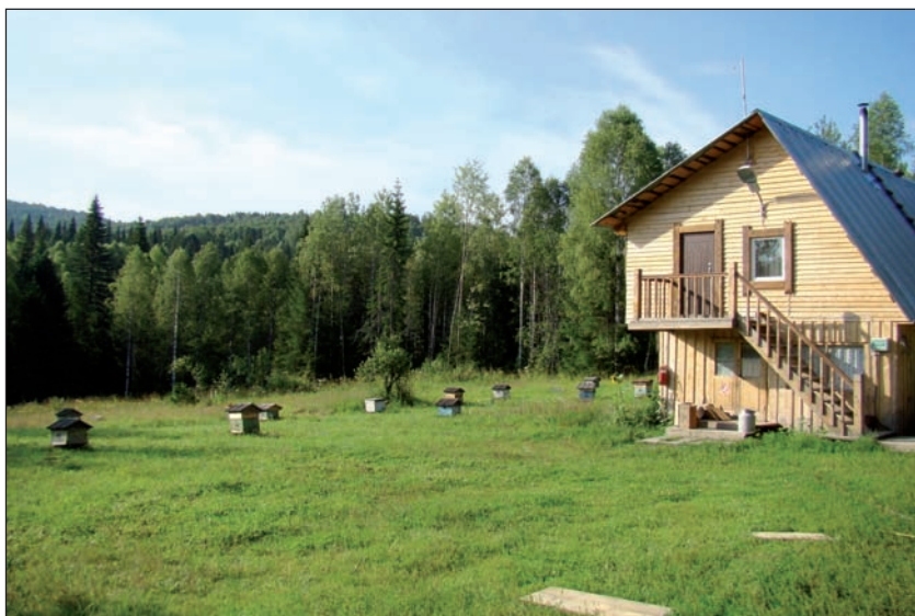
Егерский кордон в современном хозяйстве (Средне-Терсинское общество охотников и рыболовов)