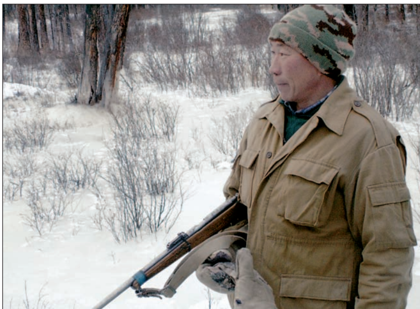
Для коренных малочисленных народов России охота до сих пор один из основных видов деятельности