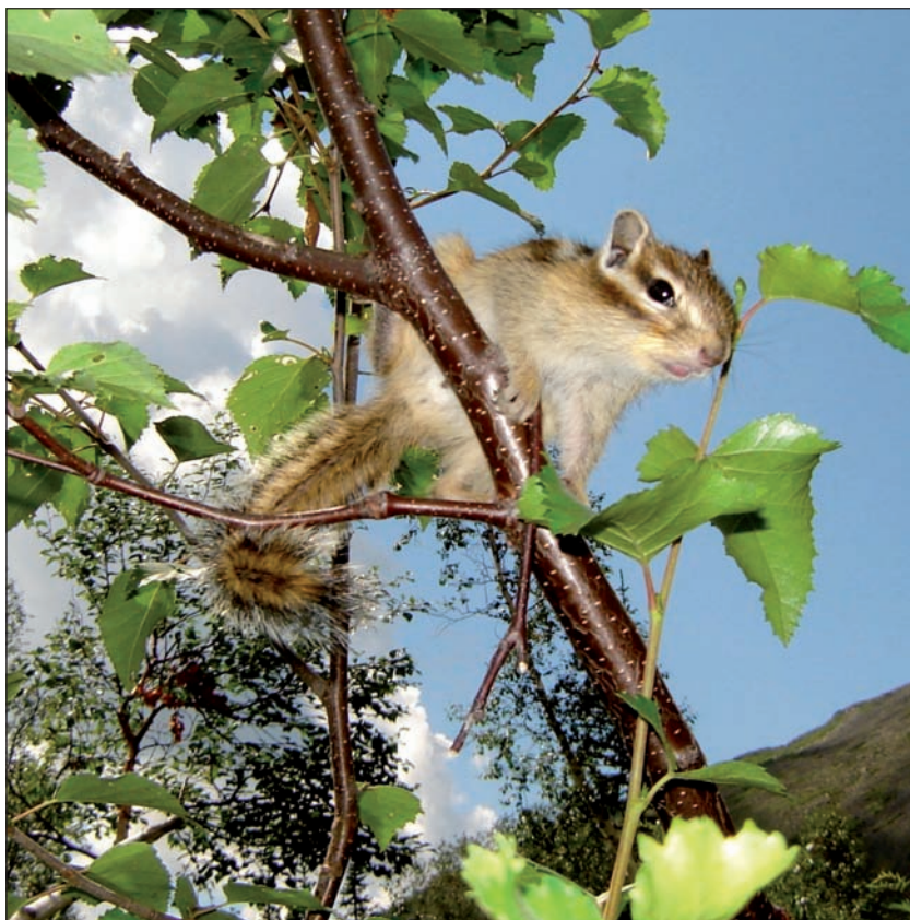
Один из промысловых видов в послевоенные годы – бурундук