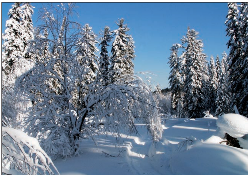
Лесная категория угодий - черневая тайга зимой