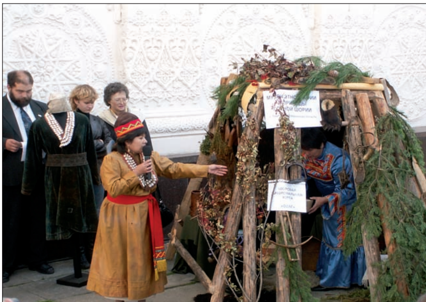
Охотничья юрта одаг - жилище охотника-шорца