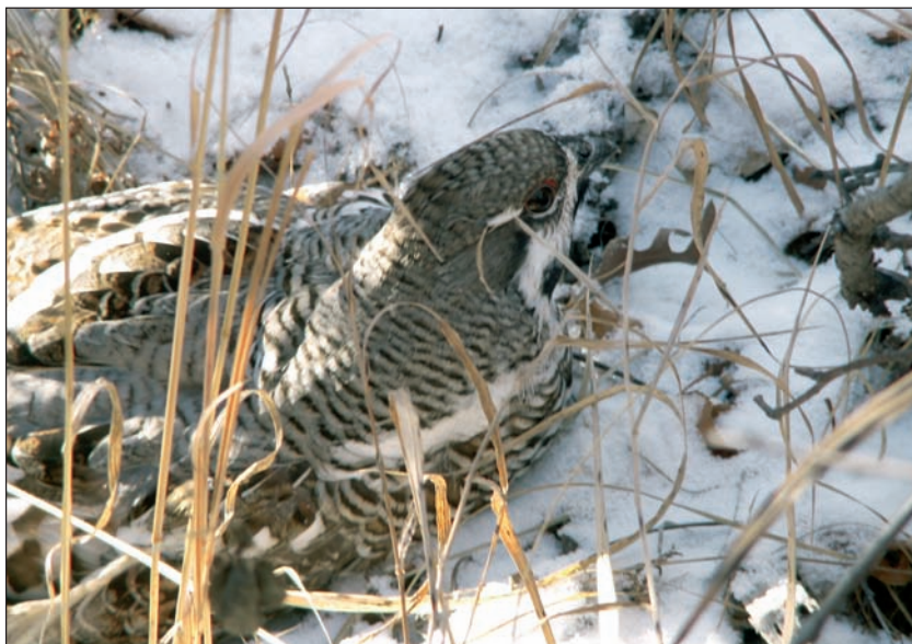
Фоновый вид куриных горной тайги – рябчик.