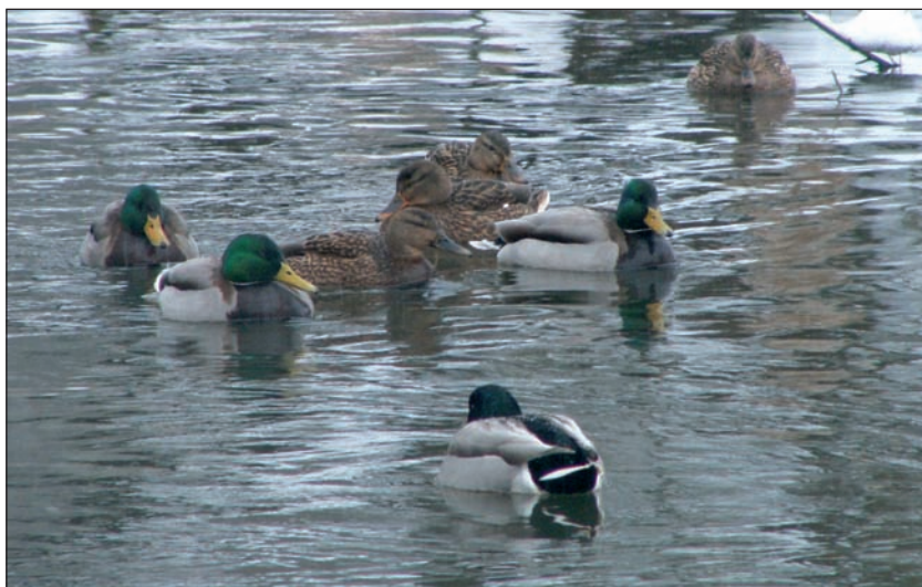
Весенняя охота на самцов уток – средство поддержания оптимального соотношения самцов и самок в популяции